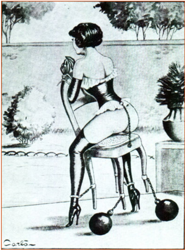
La Chaise Cloutée.